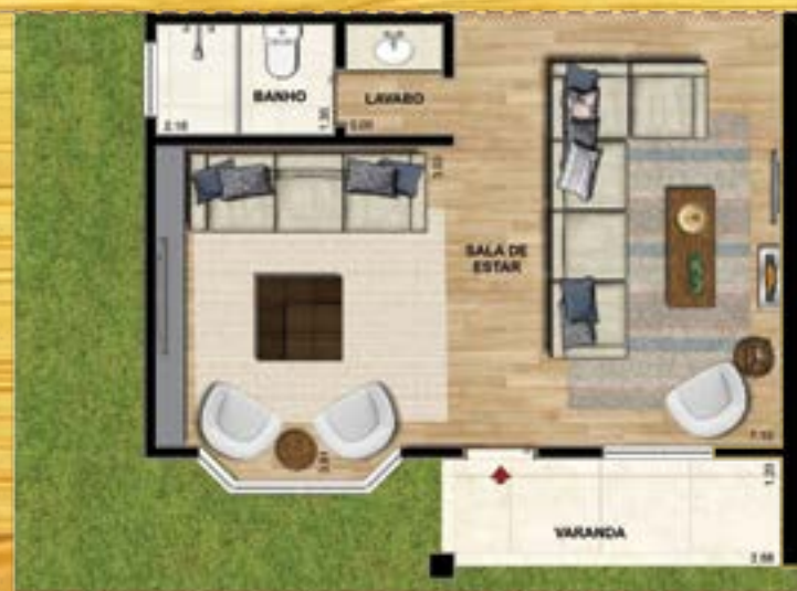
Opção de Sala Ampliada

Área privativa: 168 m 2 45 m 2 de Mansarda - Total : 213 m 2