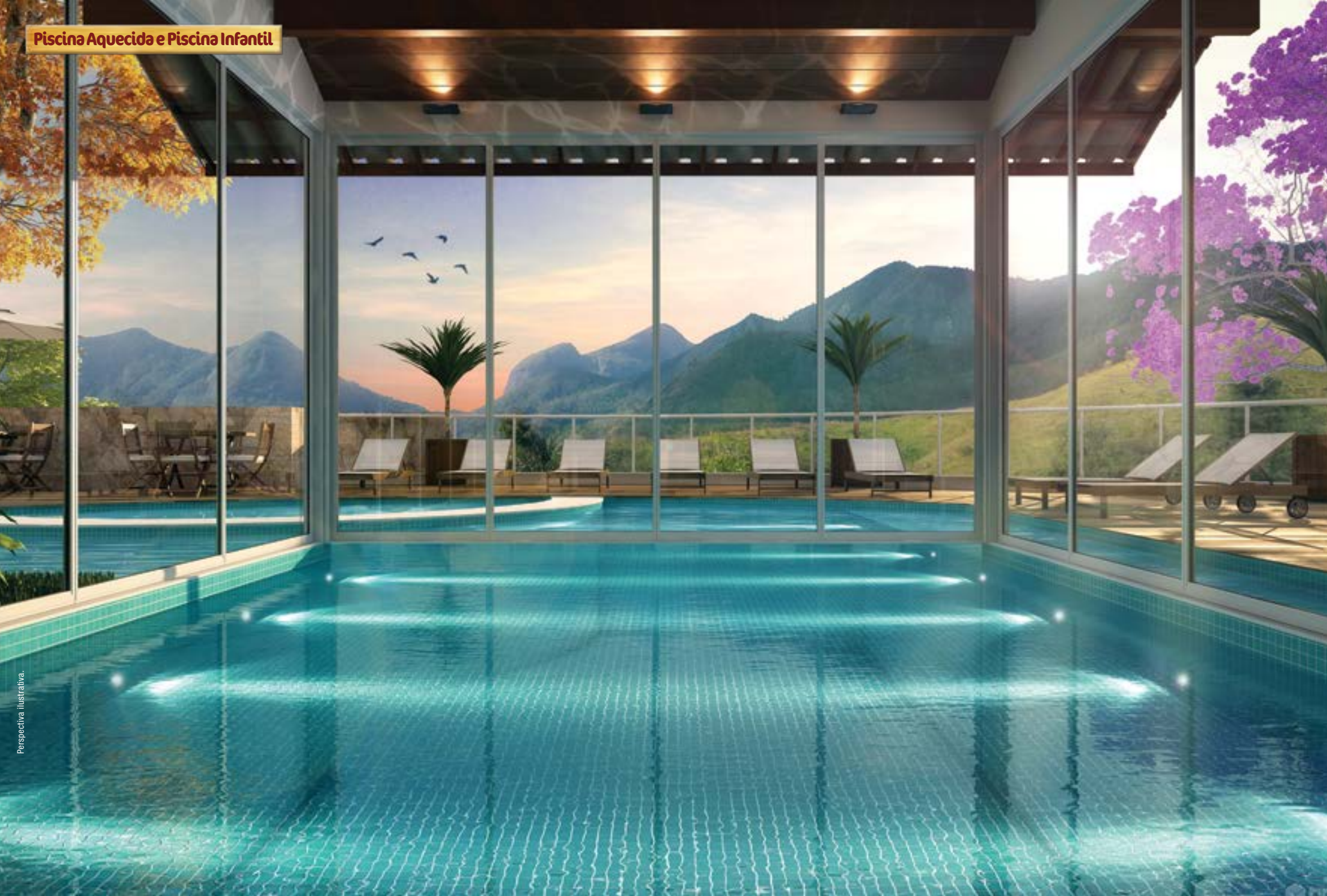
Piscina Aquecida e Piscina Infantil

Espaços inspirados no que há de mais belo: a natureza.