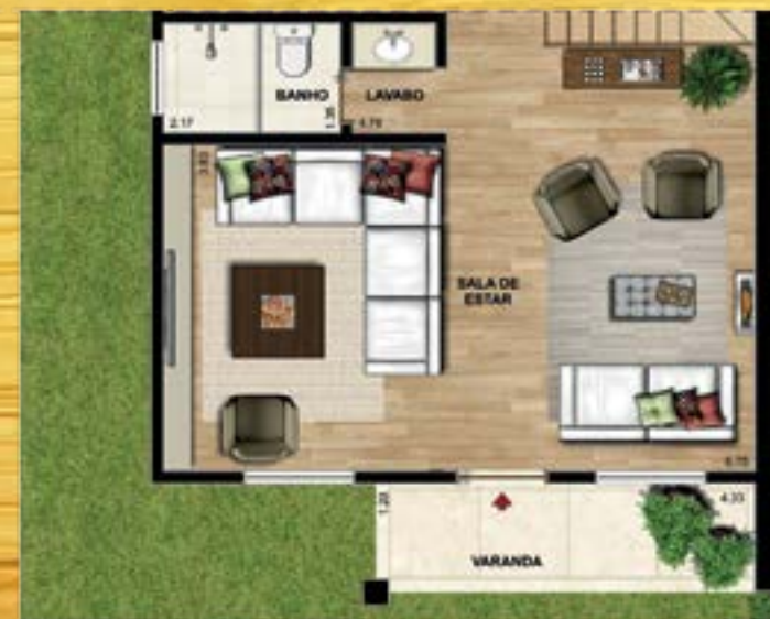
Opção de Sala Ampliada